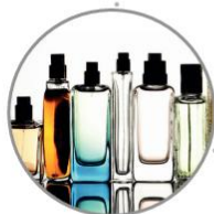
FLACONS DE PARFUM