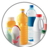
BOUTELLES ET FLACONS EN PLASTIQUES